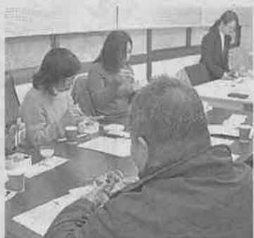
非営利団体の薬膳講座で、講師が用意した弁当を食べる参加者。1月、東京都台東区。

(飲食店経営の男性)と健康意識が軒並み高い。管理栄養士の女性は「うなずく内容が多い。知識をもっと身に付けたい」と話した。