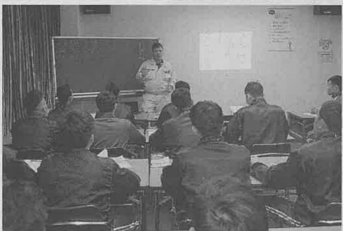
稼働した「東海研修所知多」